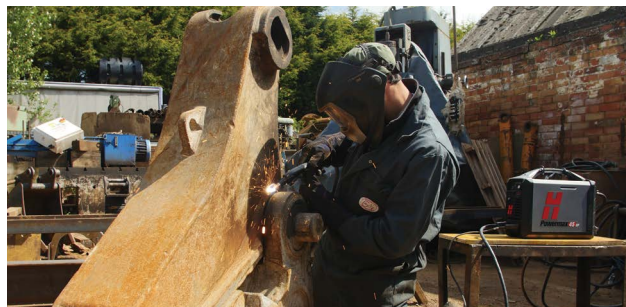
Kunnossapito ja korjaus